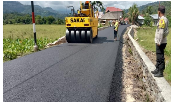
Ruas Jalan Surantih-Kayu Aro-Langgai (P.086)