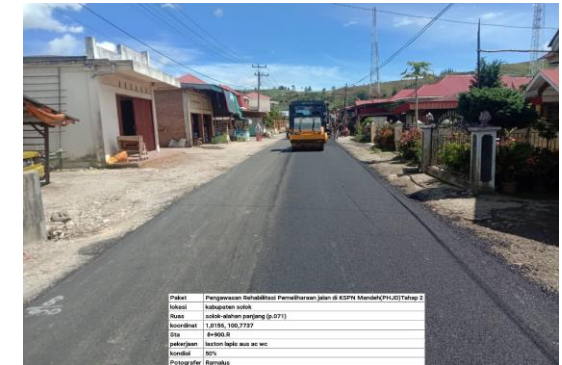
Ruas Jalan Solok – Alahan Panjang (P.071)