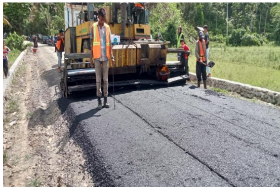
Ruas Jalan Batu Batembak-Pelabuhan Panasahan (P.100)